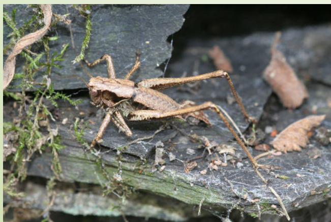
Antaxie (O. Duval)