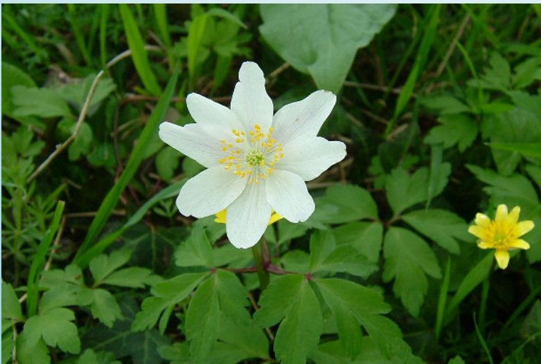
Anémone des bois (O. Duval)