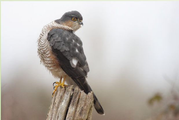
Épervier d'Europe (P. Houalet)