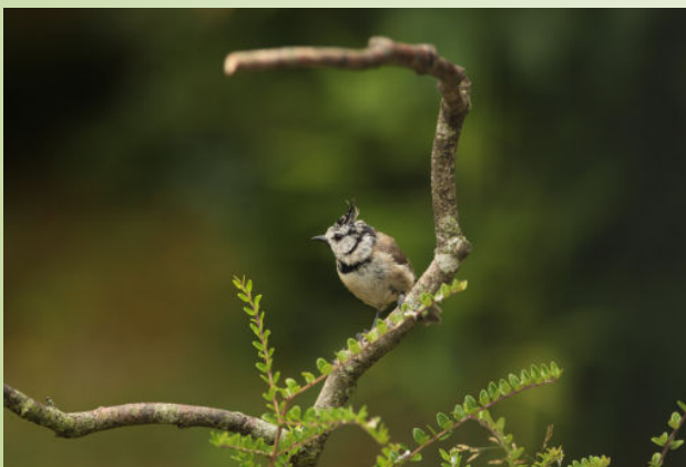
Mésange huppée (B. Foulard)